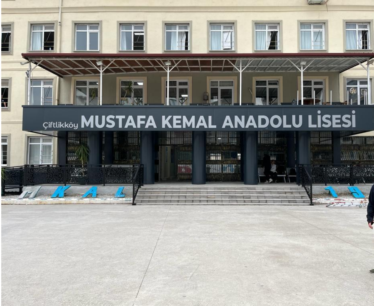
Mustafa Kemal Anadolu Lisesi;